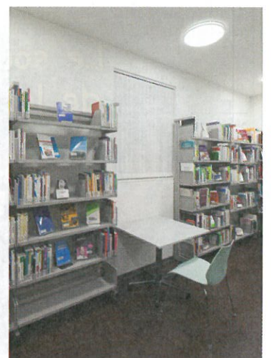
La bibliothèque Pourtalès