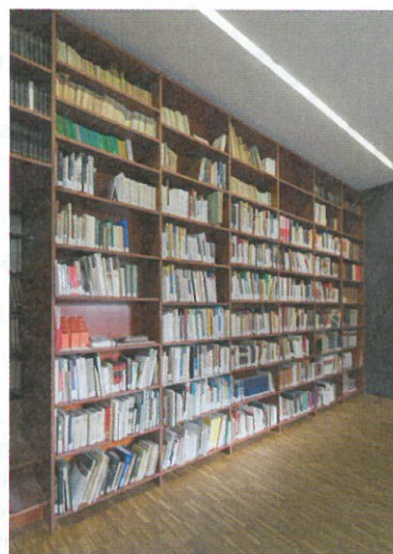
Les Archives de la Ville