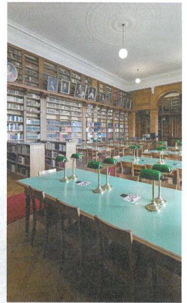
La salle de lecture de la BPU