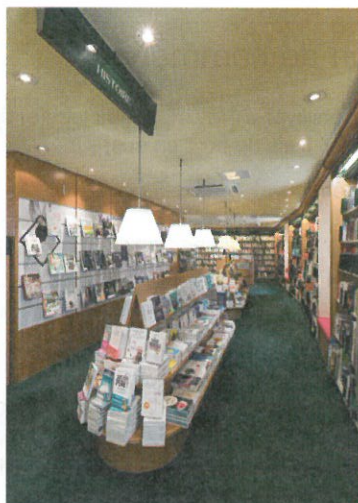
La librairie Payot