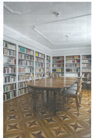
Bibliothèque personnelle de Friedrich Dürrenmatt (1921-1990), Centre Dürrenmatt de Neuchâtel